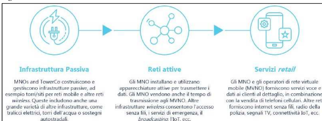
Figura 2: Le relazioni verticali nel settore delle telecomunicazioni.

12. L’offerta di servizi di ospitalità comprende la messa a disposizione dello spazio sull’infrastruttura passiva, per il quale i clienti pagano un canone al fornitore. Gli operatori di rete mobile (MNO) installano sulle infrastrutture passive apparecchiature Radio Access Network (RAN) come antenne, radio e unità in banda base sulle torri per la trasmissione di segnali mobili. L’insieme delle reti attive e dell’infrastruttura passiva consente al MNO di fornire servizi vocali e di trasmissione dati. La figura 2 che segue descrive i rapporti di filiera all’interno di settore.